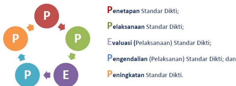
Gambar 2.1 Siklus PPEP

SPMI dirancang, dilaksanakan dan ditingkatkan mutunya secara berkelanjutan dengan berdasarkan pada model PPEPP yang dapat dilihat pada gambar berikut